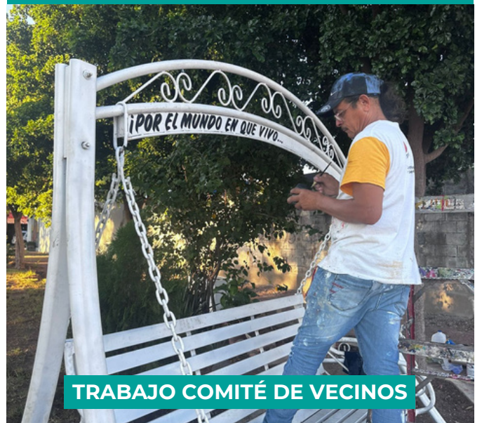
TRABAJO COMITÉ DE VECINOS