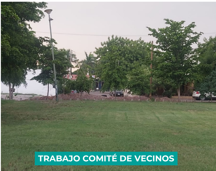
TRABAJO COMITÉ DE VECINOS